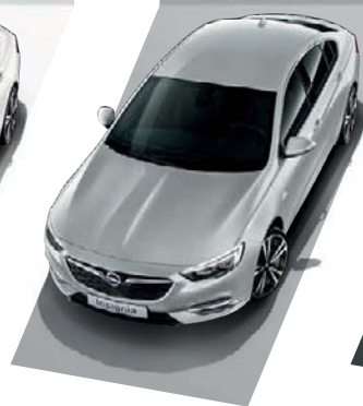
Sovereign Silver Μεταλλικό