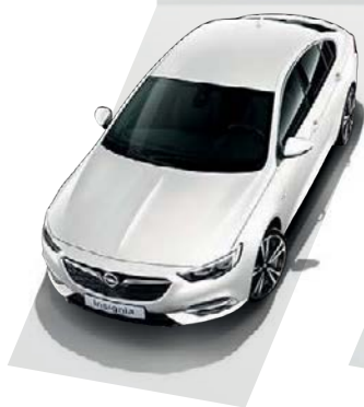
Summit White Απλό