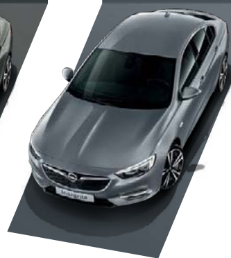
Satin Steel Grey Μεταλλικό