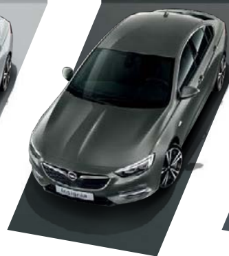
Cosmic Grey Μεταλλικό