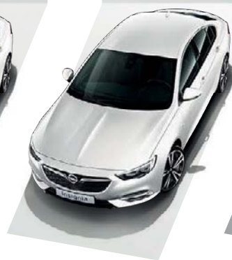
Abalone White Περλέ χρώμα τριπλής επίστρωσης