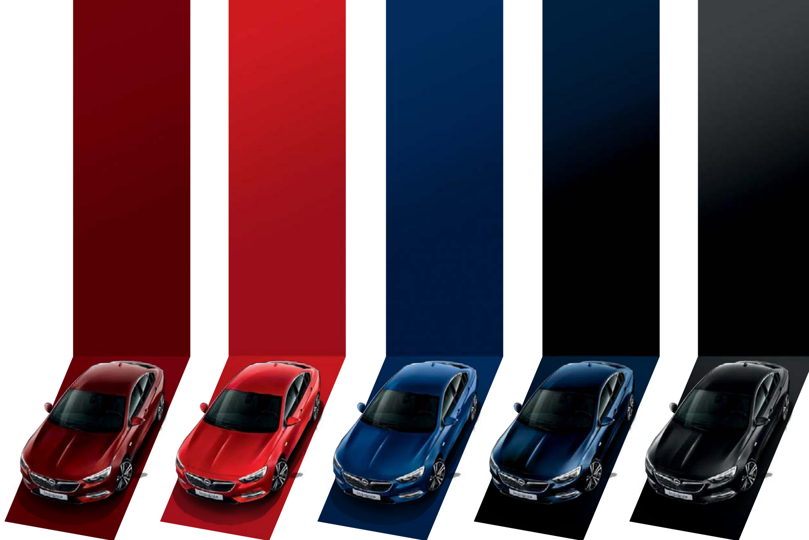
Rouge Brown Μεταλλικό