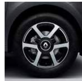
Ζάντα αλουμινίου 15" Argos (προαιρετικά, στις έκδ. Excite και Intens)