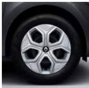
Τροχός 15" με τάσι Μακαο (στάνταρ στην έκδ. In-Touch)