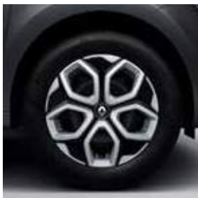
Τροχός 15" με τάσι Vegas (στάνταρ στην έκδ. Excite)