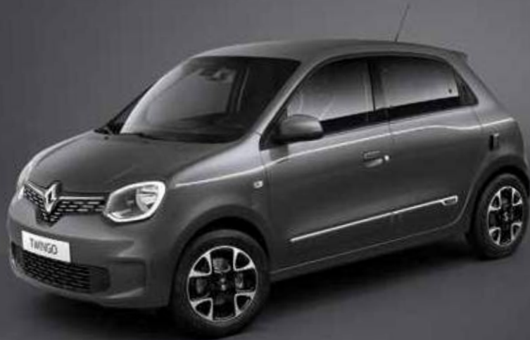
Γκρι Cosmic (TE)