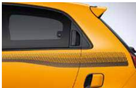
Πλευρικό αυτοκόλλητο Cosmic (μαύρο ή λευκό ανάλογα με το χρώμα του αμαξώματος)*