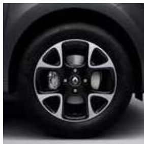
Ζάντα αλουμινίου 15" Venetian (στάνταρ στην έκδ. Intens, προαιρετικά στην έκδ. Excite)