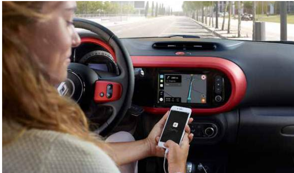
Core Audio Display με οθόνη πολυμέσων 7", συμβατό με λογισμικό Android Auto™ και Apple CarPlay™.