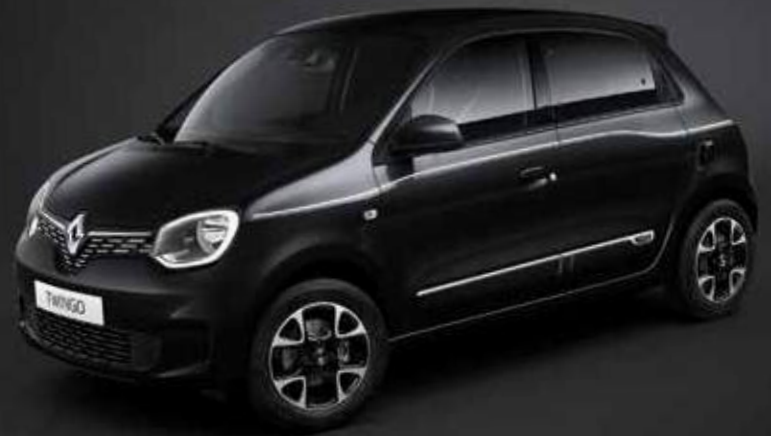
Μαύρο Etoile (TE)