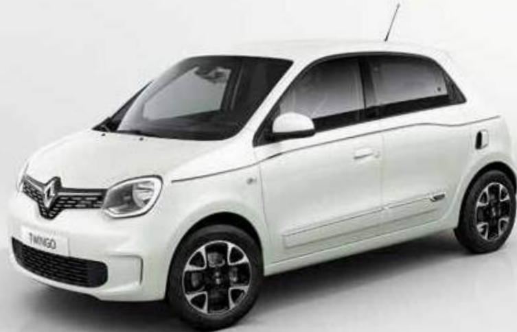
Λευκό Quartz (*)