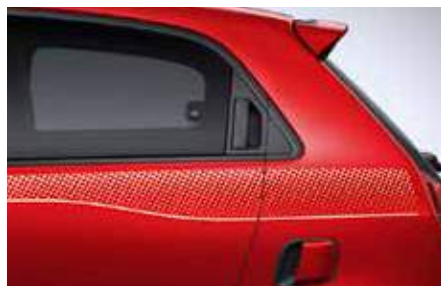
Πλευρικό αυτοκόλλητο Dots (μαύρο ή λευκό ανάλογα με το χρώμα του αμαξώματος)**