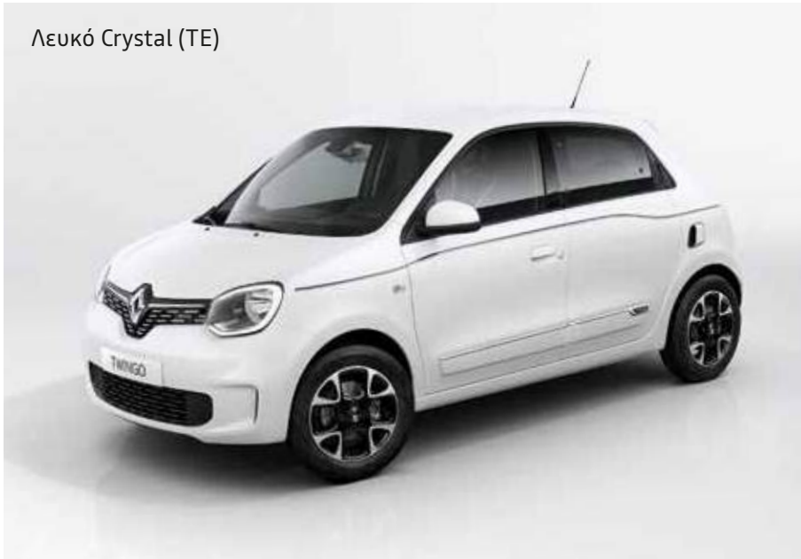
Λευκό Crystal (TE)