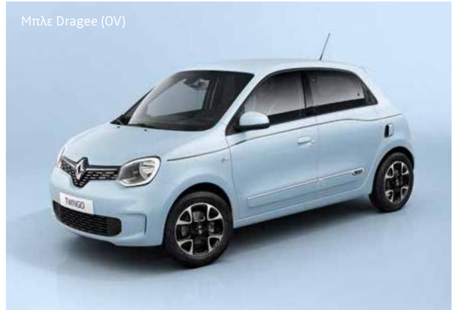
Μπλε Dragee (OV)