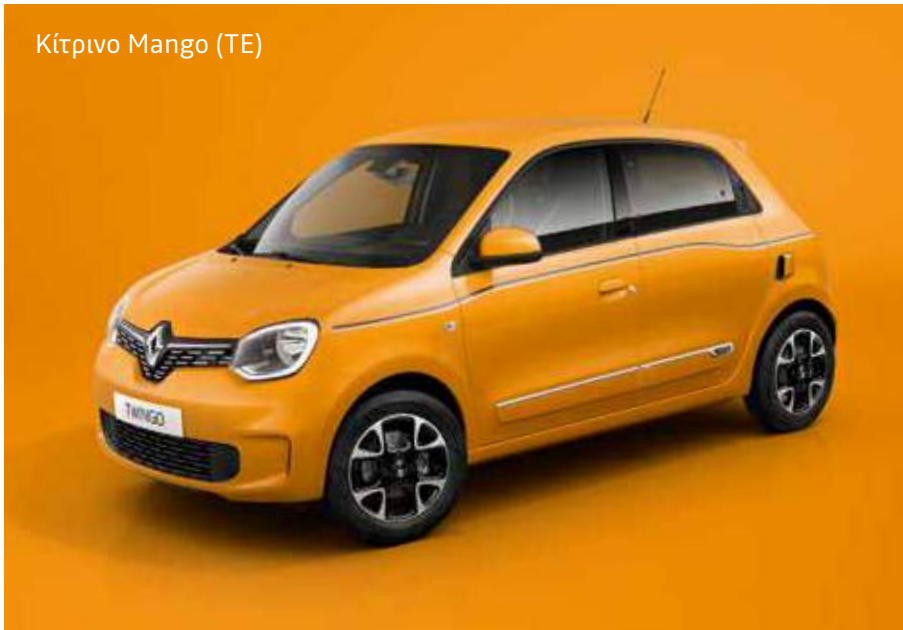
Κίτρινο Mango (TE)