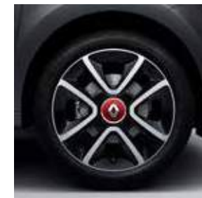
Ζάντα αλουμινίου 16" Juvaquatre (προαιρετικά, στην έκδ. Intens)