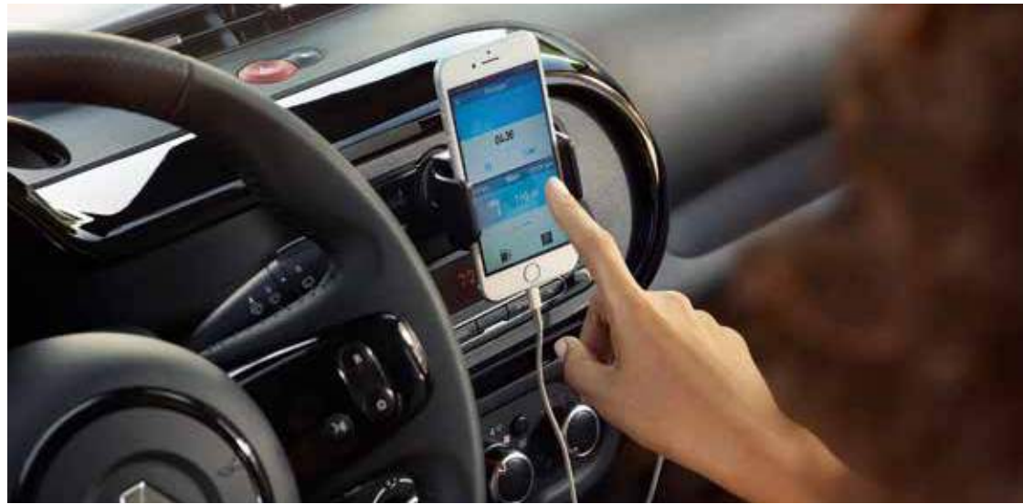
Ηχοσύστημα Connect R & GO με δυνατότητα υποστήριξης εφαρμογών smartphone.