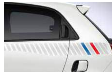
Πλευρικό αυτοκόλλητο Tricolore****