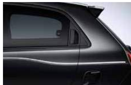
Πλευρικό αυτοκόλλητο με 3 ρίγες***