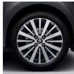
Ζάντα αλουμινίου 16" Monega (προαιρετικά στην έκδ. Intens)