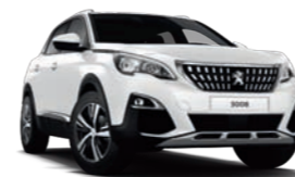
Blanc Banquise παστέλ**