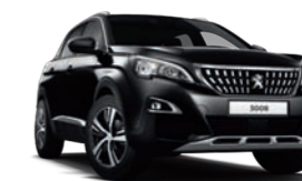
Noir Perla Nera μεταλλικό