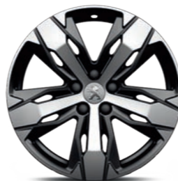
Ζάντες ελαφρού κράματος 18" LOS ANGELES bi-ton diamantée*

Προσεγγμένο μέχρι και την τελευταία λεπτομέρεια, το PEUGEOT 3008 SUV φορά τις πιο εντυπωσιακές ζάντες.