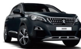
Gris Hurricane παστέλ

Έχετε στη διάθεσή σας δέκα χρωματικές επιλογές για να εκφράσετε τον χαρακτήρα και το γούστο σας.