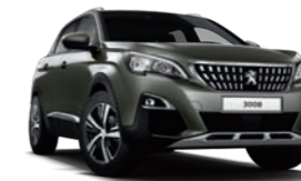
Gris Amazonite μεταλλικό