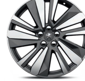
Ζάντες ελαφρού κράματος 19" WASHINGTON bi-ton diamantée*

* Στον βασικό, τον προαιρετικό εξοπλισμό ή μη διαθέσιμες, ανάλογα με την έκδοση.