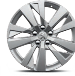
Ζάντες ελαφρού κράματος 17" CHICAGO*