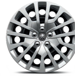
Ατσάλινες ζάντες 17" με τάσι MIAMI*