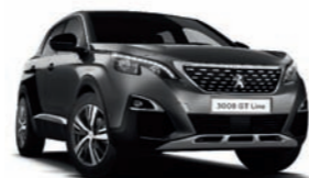
Gris Platinium μεταλλικό*