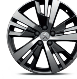
Ζάντες ελαφρού κράματος 18" DETROIT bi-ton diamantée*