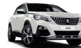
Blanc Nacré περλέ