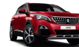
Rouge Ultimate ειδικής επίστρωσης

* Διαθέσιμο αποκλειστικά στις εκδόσεις GT Line & GT. ** Δεν διατίθεται στις εκδόσεις GT Line & GT.