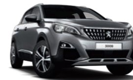
Gris Artense μεταλλικό**