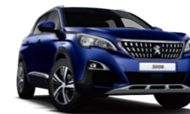
Bleu Magnetic μεταλλικό