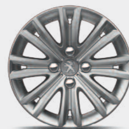
Ζάντα αλουμινίου 15" HARVEY*