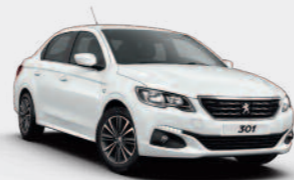
Ice filed White