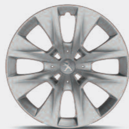
Ατσάλινη ζάντα 15" με τάσι τύπου BORE*