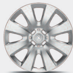
Ατσάλινη ζάντα 15" με τάσι τύπου HOBART*

* Στο βασικό ή προαιρετικό εξοπλισμό, ανάλογα με την έκδοση,